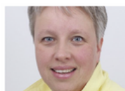
Nieuw bestuur en voorzitter LEES MEER ●