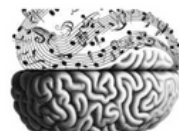
Start muziekproject met ICO LEES MEER ●